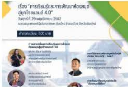
ประชุมใหญ่สามัญประจำปี 2562 ชมรม ห้องสมุดเชียงใหม่ และการประชุม วิชาการ เรื่อง "การเรียนรู้และการ พัฒนาห้องสมุดสู่ยุคไทยแลนด์ 4.0"