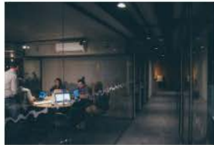
ประชุมคณะกรรมการบริหารชมรมห้อง สมุดเชียงใหม่ ครั้งที่ 4/2562