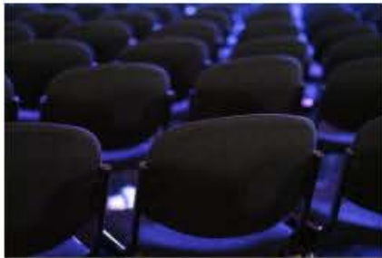
ตรวจสอบรายชื่อผู้ลงทะเบียนการประชุม ใหญ่สามัญประจำปี 2562