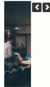
ประชุม สมุ